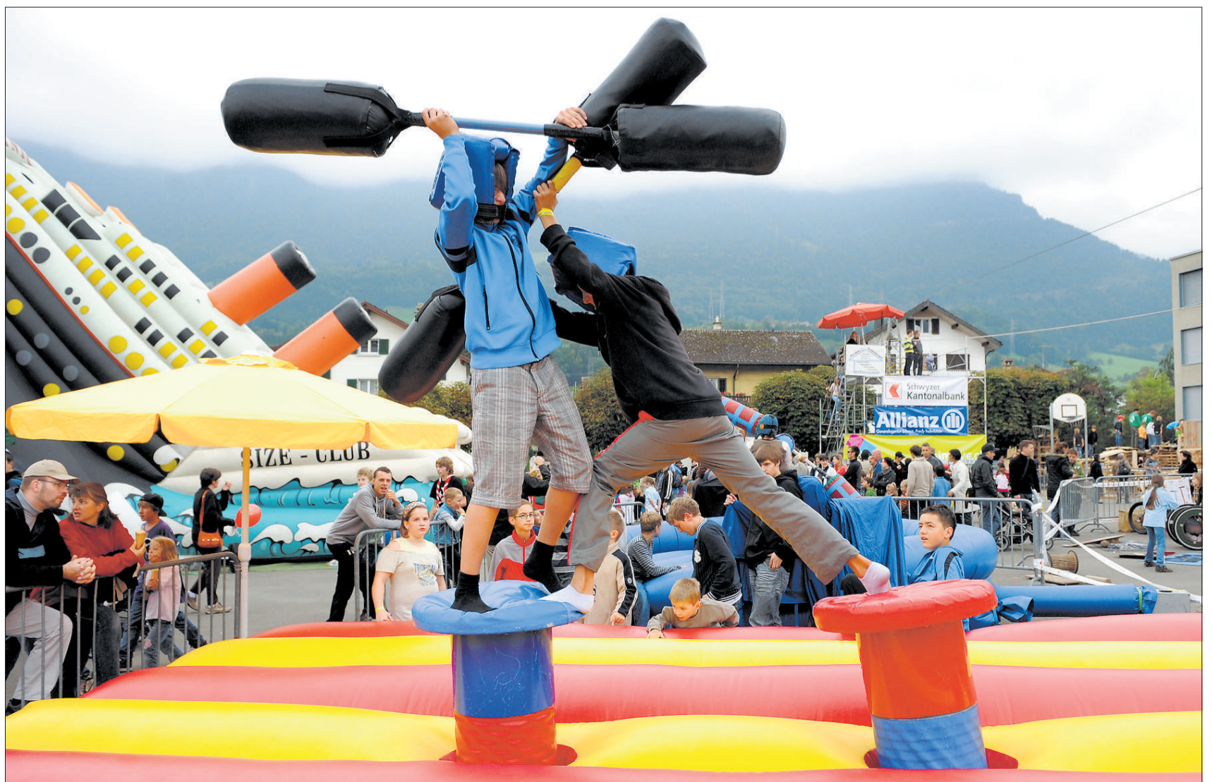
Am Chinderfäscht in Goldau wurde einmal mehr bewiesen: Muskelkraft kann sehr viel Spass machen.

Die Helfer gehören den Jugendorganisationen des Dorfes an. Das Chinderfäscht Goldau hat sich weit herum einen Namen gemacht. So trifft man Familien aus der ganzen Deutschschweiz an. 75 Prozent der Kosten sind durch Sponsoren abgedeckt. «Es ist eine Non-Profit-Veranstaltung», sagen die Initianten. «Für uns zählen nur die fröhlichen Gesichter.»